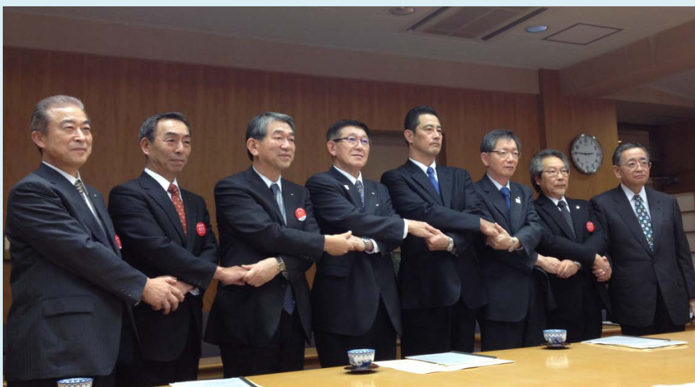
△秋田県庁にて行われた業務協力協定締結式の様子

秋田銀行、北都銀行、秋田信用金庫、羽後信用金庫、秋田県信用組合、秋田県信用保証協会